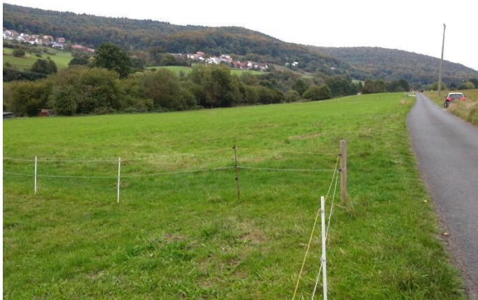
Blick auf die Ausgleichsfläche (links: Geltungsbereich B-Plan)