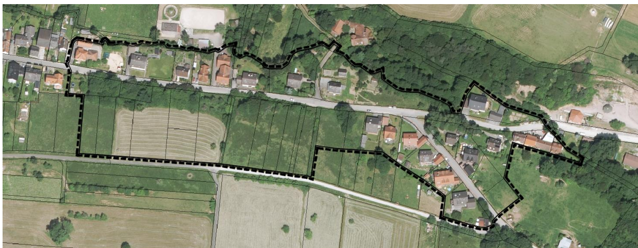
Geltungsbereich Bebauungsplan „Wilhelminenstraße“

Im Flächennutzungsplan sind die Flächen südlich der Wilhelminenstraße als allgemeines Wohngebiet, nördlich davon sowie im Bereich des Haidbergweges als Dorfgebiet ausgewiesen.