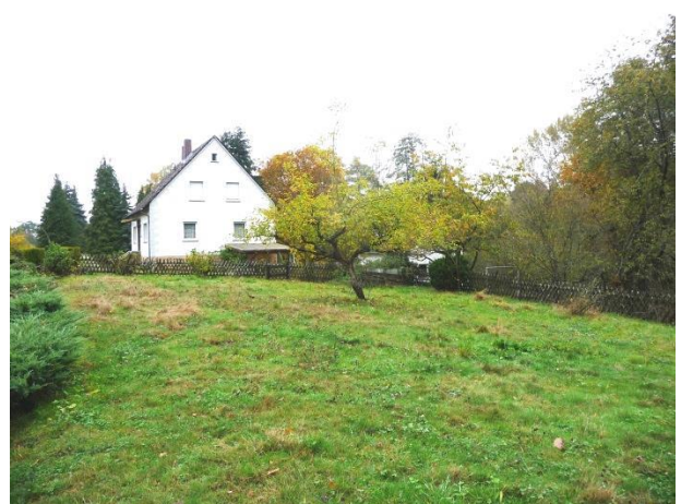
... und geplantes Baugrundstück im Westen angrenzend