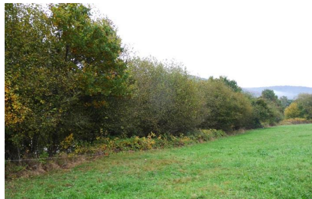
Gebüsch mit angrenzender Wiesenfläche (2016)