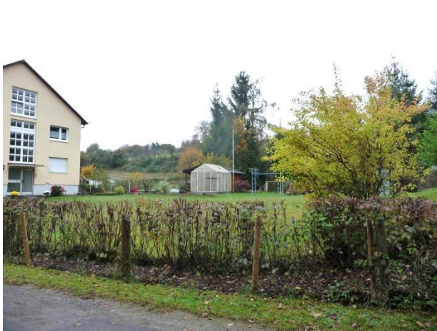
Geplantes Baugrundstück, aktuell als Rasenfläche genutzt