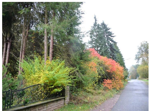
Geplantes Baugrundstück, mit Ziergehölzen bewachsen