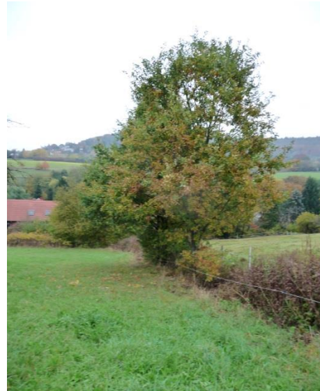
Graben mit Ufersaum und zwei jungen Eichen