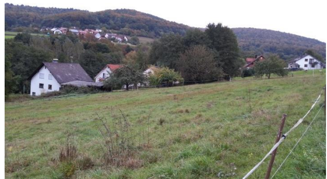
Biotop-Nr. 5921-0054-009: Frische Magerwiese mit Gehölzen (im Westen Mädesüß-Hochstaudengraben)