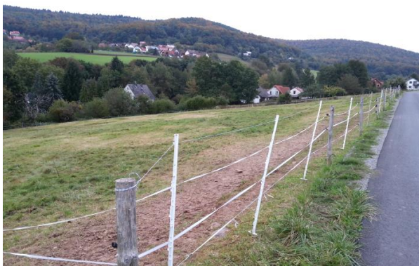
Intensiv beweidete Wiese

Zwischen den Wiesenflächen und der Wilhelminenstraße befand sich bis zum Winter 2016/2017 ein etwa 10 bis 25 m breiter Gehölzstreifen aus Weiden, Eichen, Zitterpappeln, Apfelbäumen, Brombeeren, Hartriegel, Haselsträuchern, Hundsrosen und Himbeeren. Die Bäume wiesen teilweise Höhlen und Spalten auf, die potenzielle Sommer- und Zwischenquartiere oder Fortpflanzungsstätte für verschiedene Tierarten waren. Winterquartiere wurden aufgrund des Fehlens frostfreier Baumhöhlen nicht festgestellt. Bis auf wenige Einzelbäume wurde der Gehölzbestand bereits im Winterhalbjahr gerodet.