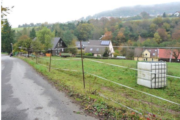
Unbebaute Grundstücke am Haidbergweg

Die Grundstücke nördlich der Wilhelminenstraße sowie entlang des Haidbergweges sind zum Großteil bereits bebaut. Es handelt sich um Häuser mit Nebengebäuden und vorwiegend strukturarme Gärten. Nordöstlich des Haidbergweges sollen zwei weitere Baugrundstücke auf einer mit zwei Obstbäumen bestandenen, mäßig artenreichen Wiese bzw. teils intensiv genutzten Rasenfläche erschlossen werden. Nördlich der Wilhelminenstraße sollen die vorhandenen Baulücken durch drei weitere Baugrundstücke geschlossen werden. Im Bestand haben diese Flächen gärtnerischen Charakter. Das westliche der drei Grundstücke wird als Rasenfläche genutzt, das mittlere ist mit Ziergehölzen bestanden und auf dem östlichen Grundstück stehen Obstbäume, eine Wacholderhecke sowie ein Gartenschuppen.