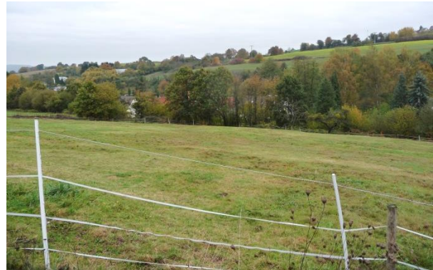
Blick vom Auweg Richtung Norden