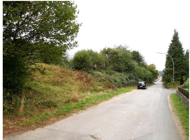
Wilhelminenstraße mit angrenzendem Gebüsch (2016)