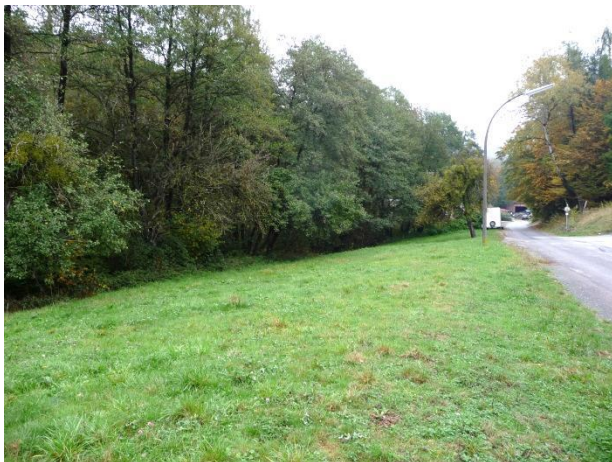
Öffentliche Grünfläche nördlich der Wilhelminenstraße...