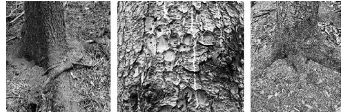
Bohrmehl am Stammfuß; Spechtschläge; Nadelverlust (v.l.n.r.)

Der Fichtenborkenkäfer hat ein enormes Vermehrungspotential. Je nach Witterungsverlauf kann er 2 – 3 Generationen im Jahr anlegen. Eine befallene Fichte kann dadurch 20 weitere Fichten „befallen“. Jede dieser 20 Fichten weitere 20 usw.