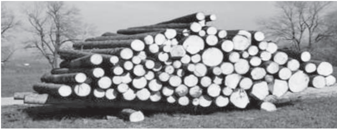
Waldschutzwirksame Lagerung 500 Meter vom Waldrand entfernt

Sie als Waldbesitzende sind gesetzlich dafür verantwortlich, dass von Ihrem Grundstück keine Gefahr für anliegenden Flurstücke ausgeht. Deshalb ist es wichtig Ihre Fichtenbestände regelmäßig (spätestens alle zwei Wochen) zu kontrollieren und ggf. zu handeln!